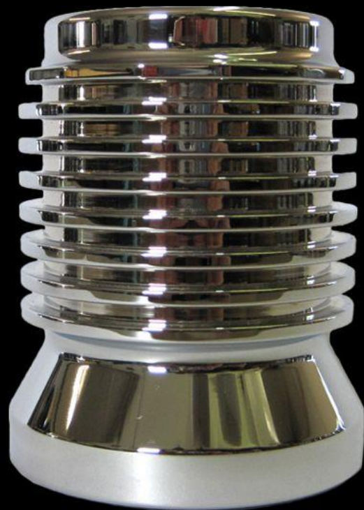
EXTENDED S44 33% BIGGER THAN THE S4