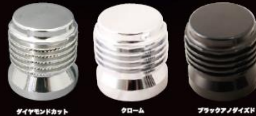
ダイヤモンドカット