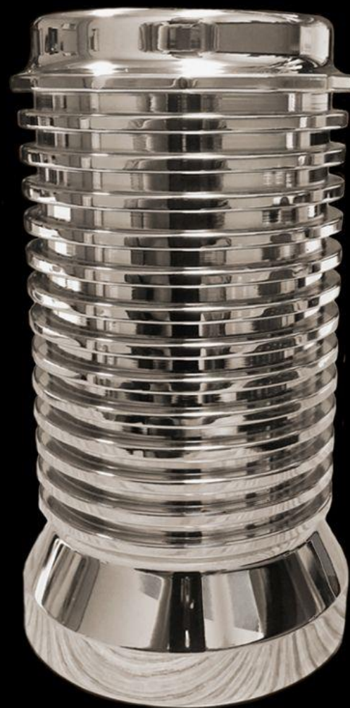
XXXL S69 100% BIGGER THAN THE S4